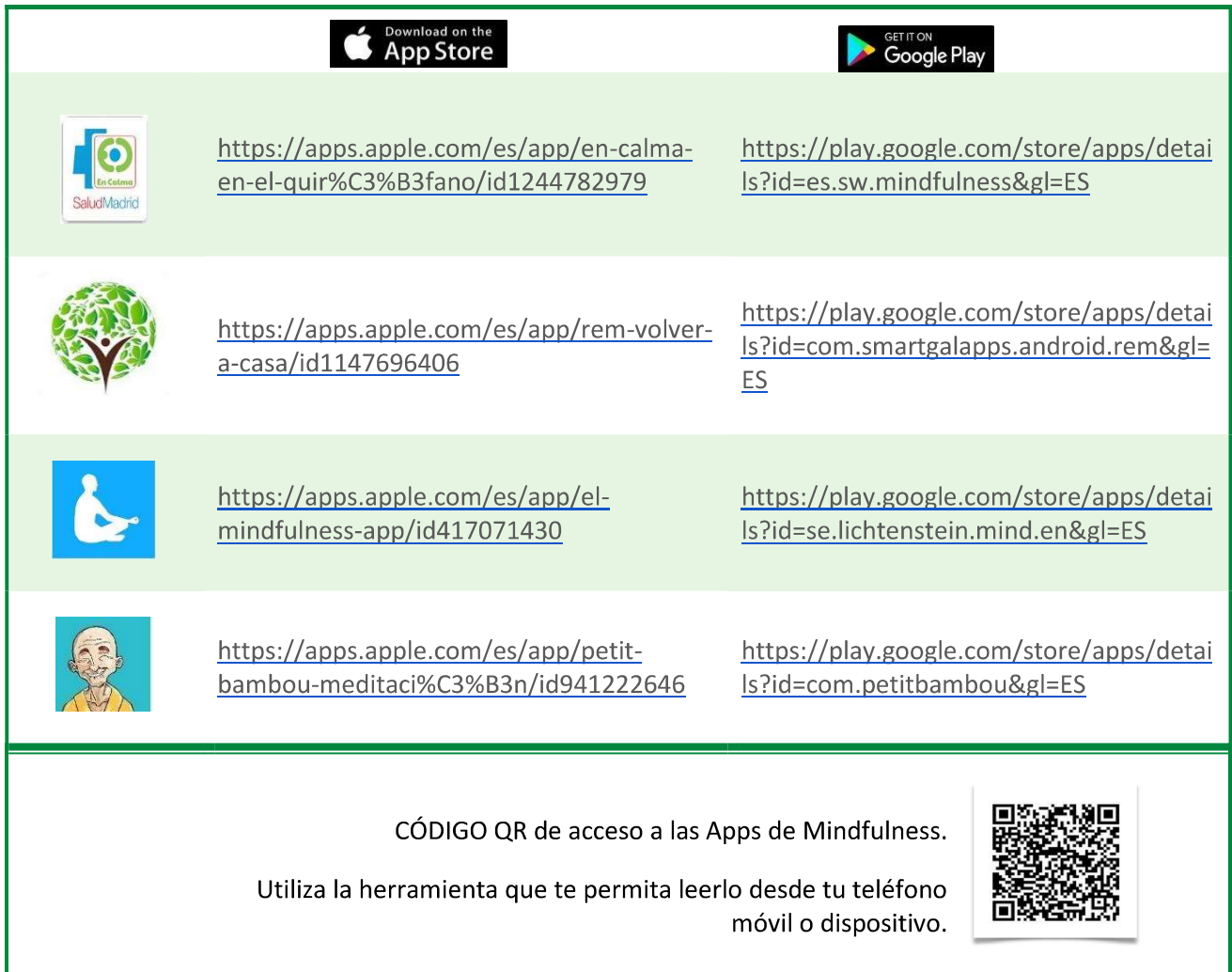
Tabla 12. APP's de Mindfulness